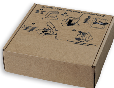
> CÂBLE COR1822 PRÉCO conditionnement dérouleur carton